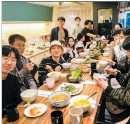
남구가 조성한 ‘청년월동기지’의 공유주방(왼쪽)과 커뮤니티 공간을 이용하는 남구의 청년들.